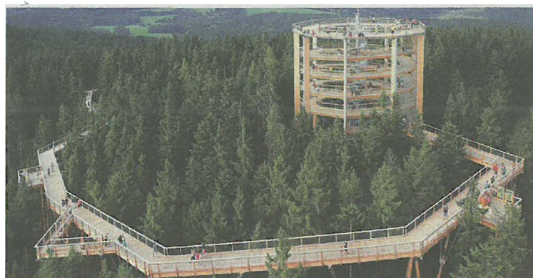
Die neue Attraktion am Grünberg stellt Naturvermittlung aus einer neuen Perspektive in den Vordergrund.

„Der Grünberg in Gmunden ist eines der beliebtesten Ausflugsziele in Oberösterreich und hat für den heimischen Tourismus eine überregionale Bedeutung. Nach der umfassenden Modernisierung der Seilbahn im Jahr 2014 wird der Grünberg mit dem Baumwipfelpfad um eine weitere Attraktion reicher. Im Mittelpunkt stehen dabei das Naturerlebnis und die Naturvermittlung aus einer neuen, ungewöhnlichen Perspektive.“, ist Landesrat Michael Strugl vom Projekt überzeugt. Auch Gmundens Bürgermeister freut sich auf die neue Attraktion: „Die Realisierung des Baumwipfelpfades auf unserem Hausberg wird Gmunden zu einer der bekanntesten Tourismusdestinationen Österreichs machen. Für alle Generationen ist dieses tolle Pro-