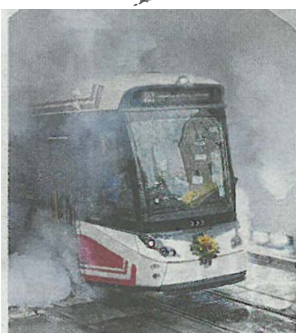
Effektvolle erste Stadtbogendurchfahrt

Wer die neue Verbindung gerne einmal ausprobieren möchte, hat übrigens bis 14. September kostenlos die Möglichkeit dazu: In den ersten zwei Wochen ist die Nutzung der Traunseetram gratis.