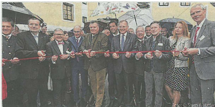
Zum „Eröffnungsschnitt“ waren neben Ehrengästen und Projektbeteiligten auch alle Festbesucher geladen – 1000 Scheren wurden ausgeteilt.