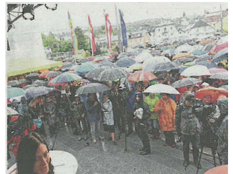
Viele Eröffnungsgäste trotzten dem Regenwetter.