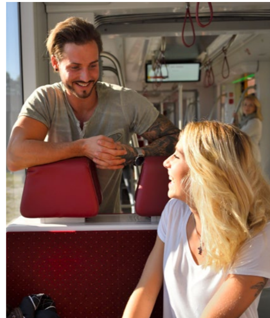
Die Zukunft der Mobilität ist auf Schiene.